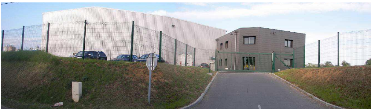
L'entrée de l'établissement Roger depuis la RD 29

Côté Sud, depuis la RD 29 et avec une vitrine sur la RD 924, on observe les grands bâtiments de l'établissement Roger, de forme rectangulaire pour la plupart et de couleur sombre. Ils sont le siège de l'activité industrielle et sont entourés de vastes aires de stationnement et d'espaces verts prévus pour d'éventuelles extensions.