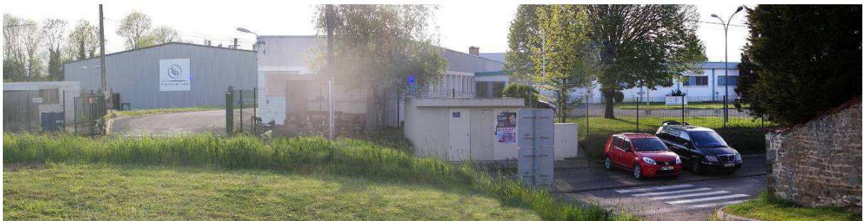
Les Verreries de l'Orne vue depuis l'espace vert à côté du parking public du cimetière

Côté Sud, depuis la RD 29 et avec une vitrine sur la RD 924, on observe les grands bâtiments de l'établissement Roger, de forme rectangulaire pour la plupart et de couleur sombre. Ils sont le siège de l'activité industrielle et sont entourés de vastes aires de stationnement et d'espaces verts prévus pour d'éventuelles extensions.