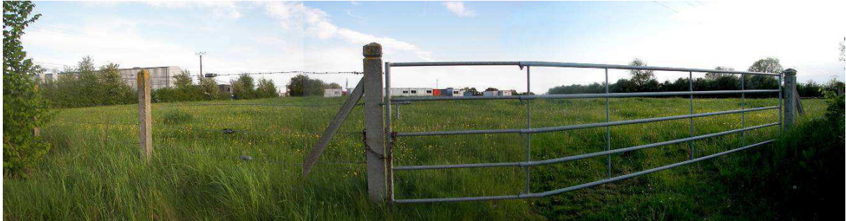
Vue sur le terrain projet de l'extension, depuis le chemin agricole au Nord

Aujourd'hui, la 1ère tranche de la ZA Saint-Nicolas compte essentiellement des entreprises de grande taille : les Verreries de l'Orne, en bordure de la RD 424 et l'établissement Roger.