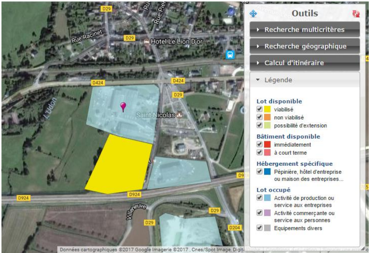
Vue aérienne et localisation de la ZA Saint Nicolas