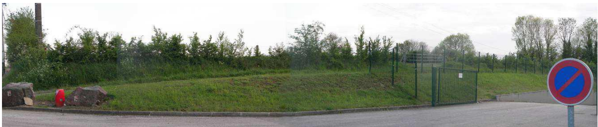
Vue sur la limite Nord du terrain projet de l'extension, avec au 1er plan, l'entrée dans l'enceinte des Verreries de l'Orne longée par le chemin agricole