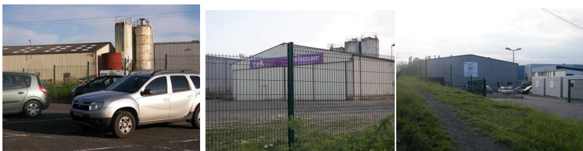
Les différents bâtiments présents sur le site Trisoplast

Les matériaux utilisés pour les bâtiments existants sont typiques des constructions industrielles : parallélépipède en bac acier avec un toit à faible pente.