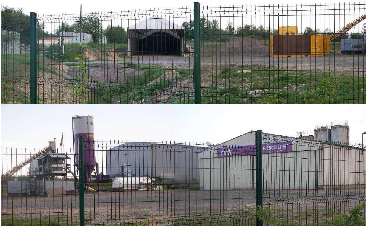
Le dépôt et le bâtiment de l'entreprise Trisoplast

La zone comprend également un dépôt de l'entreprise Trisoplast. Ce dernier est composé d'un bâtiment rectangulaire de taille moyenne, de couleur claire (blanc), de silos, citernes ou containers, de tapis roulants de transport, de structures démontables (type barnum), d'une caravane, d'engins de chantier, de souches et troncs d'arbres, etc. Il se situe au Sud immédiat du cimetière communal et est desservi par la RD 204.